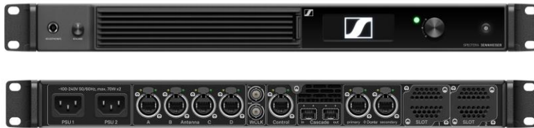
Die Spectera Base Station (Vorder- und Rückansicht)

Die Base Station im platzsparenden 19"/1 HE-Format ist das Herzstück des Spectera-Ecosystems: Sie handhabt bis zu 64 Audio-Links (bis zu 32 Ein- und 32 Ausgänge). Eine Base Station kann bis zu zwei HF-Breitbandkanäle für die drahtlose Übertragung aller Audio- und Steuerdaten nutzen. Die Base Station ist frequenzagnostisch; die Aktivierung der Base Station über die entsprechende lokale Lizenz lädt automatisch den zugelassenen Frequenzbereich.